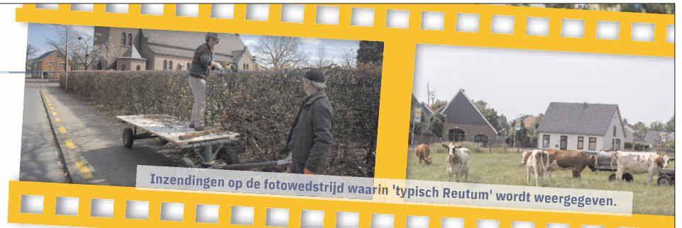
Inzendingen op de fotowedstrijd waarin 'typisch Reutum' wordt weergegeven.

Na de zomervakantie wordt het plan ter beoordeling aangeboden aan de gemeente. Daarbij blijft het uitgangspunt helder: niet alleen kijken naar wat anderen kunnen doen, maar juist ook naar wat het dorp zelf kan oppakken.