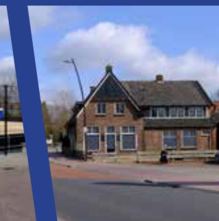
Aanzicht leegstaand pand