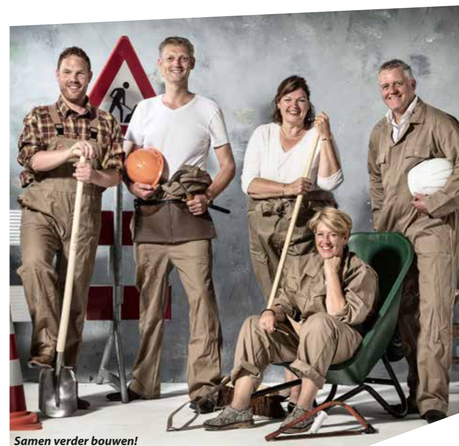
Samen verder bouwen!