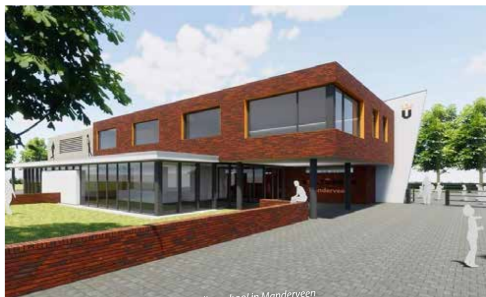
Plannen voor een nieuwe, toekomstbestendige school in Manderveen