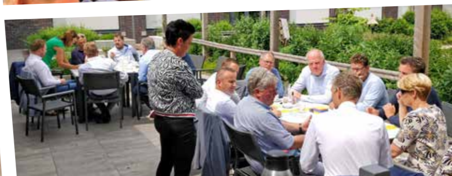
Deze zomer zijn het college en de raadsleden met inwoners en organisaties in gesprek over de agenda van de toekomst.