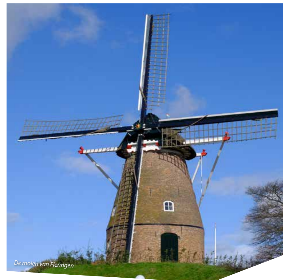
De molen van Fleringen

Eén van de drie plannen is vorig jaar gerealiseerd en begin 2018 officieel geopend. In het jubileumjaar van Voetbalclub Fleringen is een kunstgrasveld gerealiseerd. Daarnaast is het sportcomplex gemoderniseerd en multifunctioneel gemaakt.