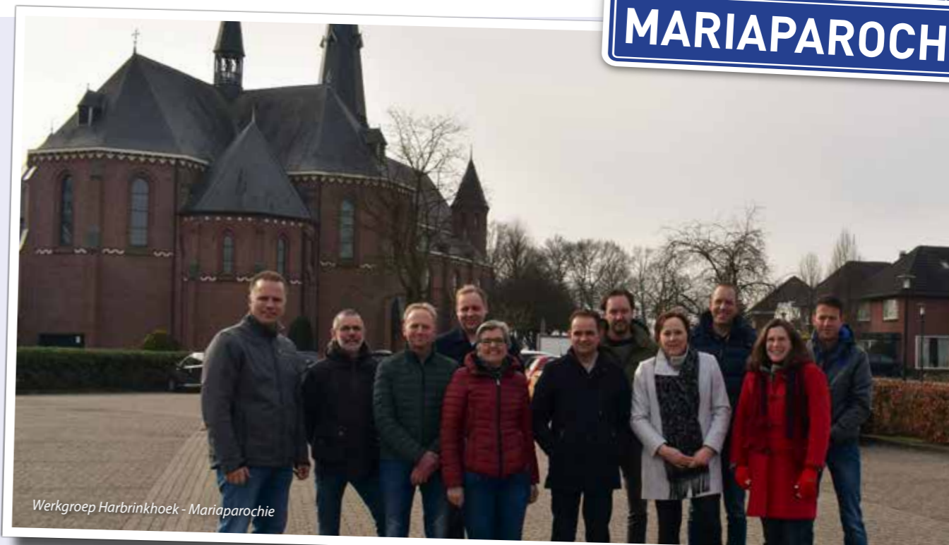
Werkgroep Harbrinkhoek - Mariaparochie