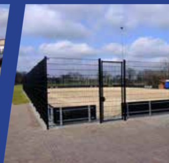
Beachveld op sportpark Loarkamp