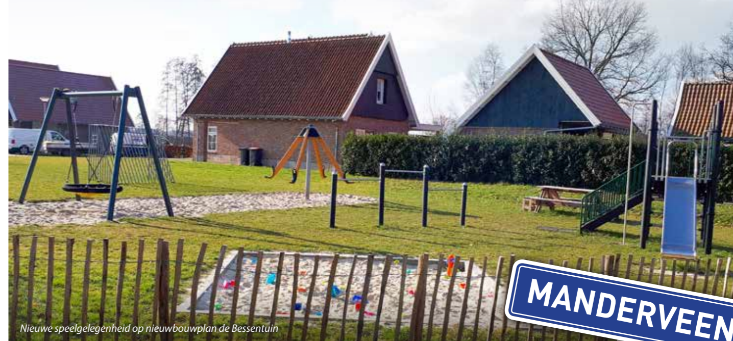
Nieuwe speelgelegenheid op nieuwbouwplan de Bessentuin