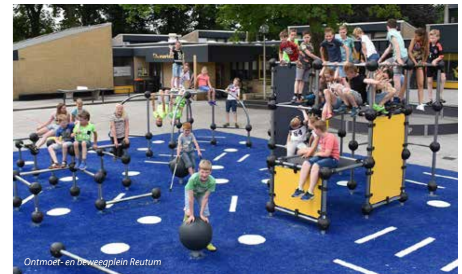
Ontmoet- en beweegplein Reutum