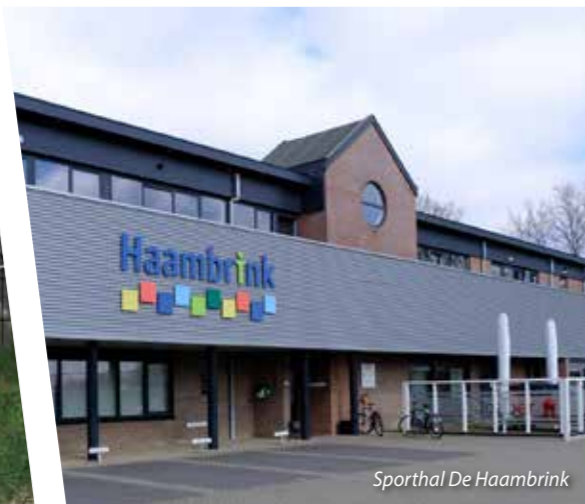
Sporthal De Haambrink